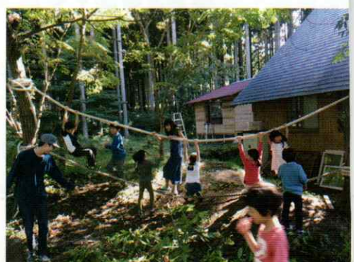
き い 【お気に入りのロープ】→