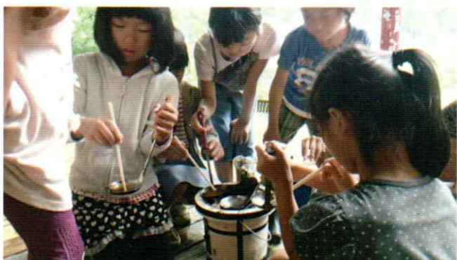
あめづく ←【べっこう餡作り 「土曜日クラス」】