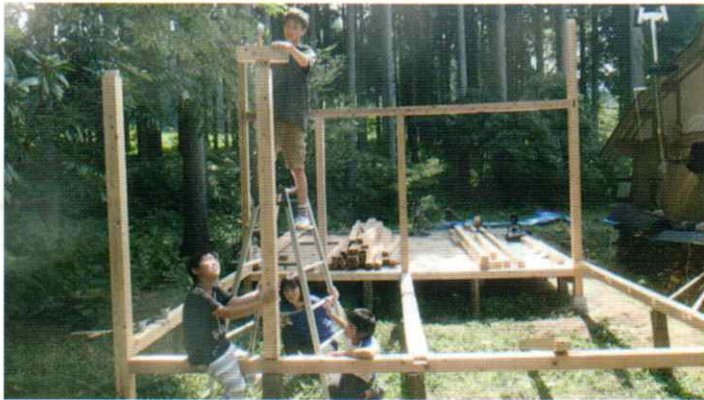
こや づく 【小屋作り】

すし、自分自身の人生を歩んでいくことになります。教科書を広げて勉強する子、読書する子、外で遊ぶ子、手作りする子、ゲームをする子、過ごし方は自由で多様です。